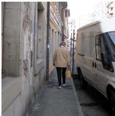
Rue Prévost-Martin : Trop étroit