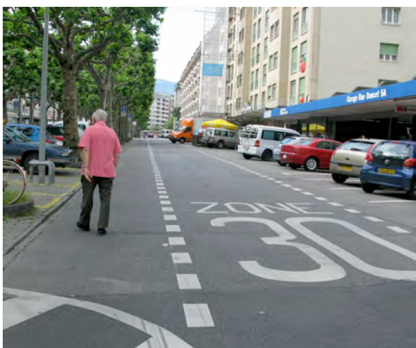
Dancet : Trop droit, trop rapide....