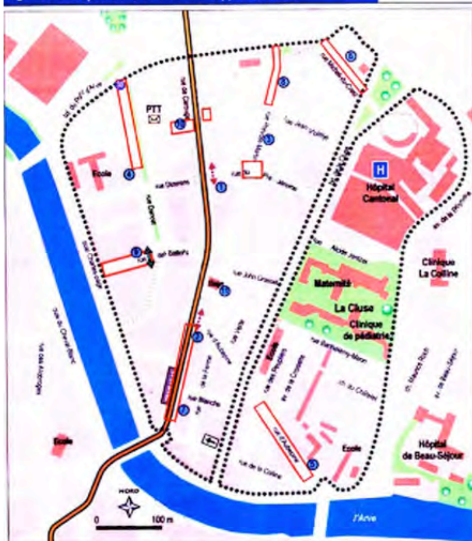
Figure 10 : Propositions de mesures supplémentaires